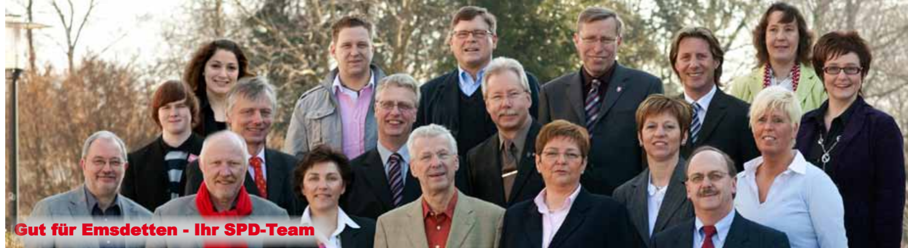
Gut für Emsdetten - Ihr SPD-Team

Liebe Emsdettenerinnen, liebe Emsdettener,