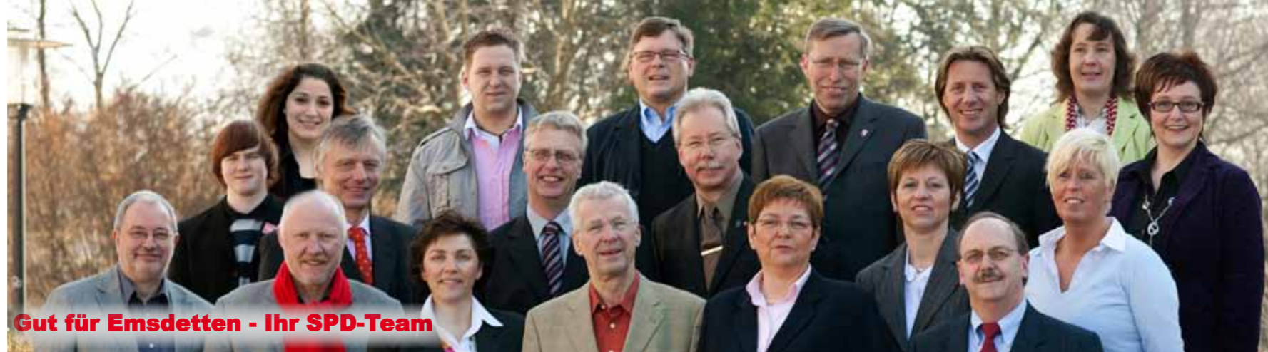
Gut für Emsdetten - Ihr SPD-Team

Liebe Emsdettenerinnen, liebe Emsdettener,