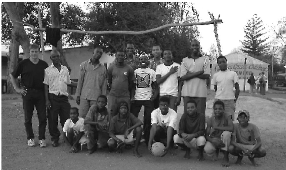
Diesen Waisenkindern wird im Rahmen der Partnerschaft durch Workcamps geholfen

Seit einigen Jahren wird die Partnerschaft zwischen Nordrhein-Westfalen und der südafrikanischen Provinz Mpumalanga immer mehr ausgebaut. Viele Bürgerinnen und Bürger haben Mpumalanga besucht und oft vor Ort in Entwick-